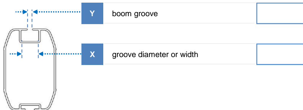
measurements in mm